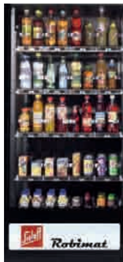
Mögliche Bestückungsvariante im Robimat 99