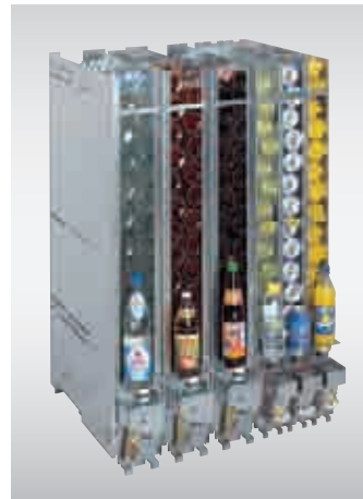
Normal- und Schmalschächte für die FK-Serie