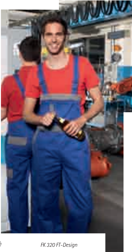
FK 320 FT-Design