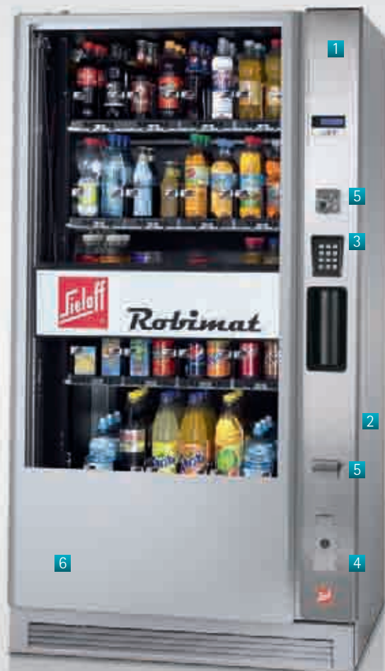
Robimat 99 im High-Security-Design

Schnell und spektakulär: Das faszinierende Sielaff-Liftsystem macht die nahezu schüttelfreie Produktausgabe zur Verkaufsshow, die höchstens 10 Sekunden dauert. Zwischen zwei Verkäufen zieht der programmierbare Werbelauf des Lifts permanent die Aufmerksamkeit auf sich.