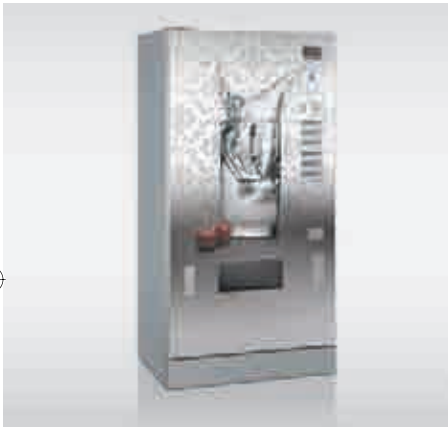
FK 170 im CV-Design

Mögliche Optionen sind unter anderem der Eingreifschutz bei der Produktausgabe und die abschließbare Kasseneinheit als Diebstahlschutz. Der Flaschenöffner mit Auffangbehälter zeigt, dass der Sielaff-Servicegedanke in jedem Detail steckt.