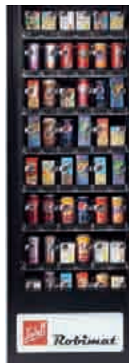
Mögliche Bestückungsvariante im Robimat 75

Die beiden Warenfachbreiten des Robimats erlauben eine enorme Produktvielfalt. Bis zu 48 bzw. 64 unterschiedliche Getränke in Gebindegrößen von 0,2 bis 1,25 Liter kann der Robimat verkaufen. Das First-in-first-out-Prinzip garantiert bei beiden Versionen, dass zuerst aufgefüllte Getränke zum Verkauf gelangen. Die Ausgabe – beim Robimat mittels Liftsystem – funktioniert dabei weitestgehend schüttel- und erschütterungsfrei.