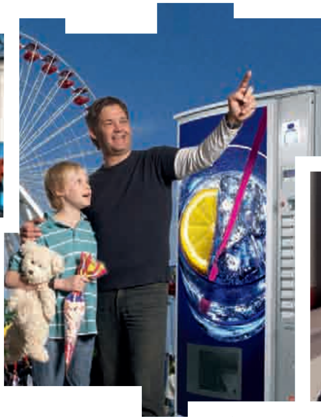
FK 280 Outdoor