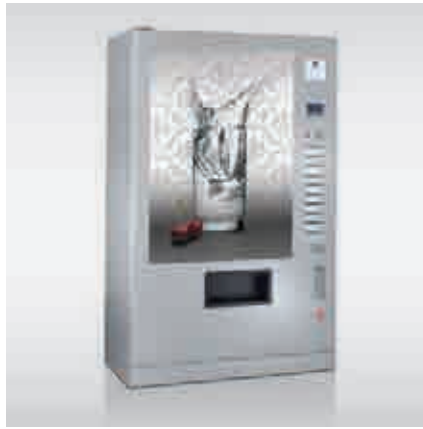
FK 230 im FT-Design