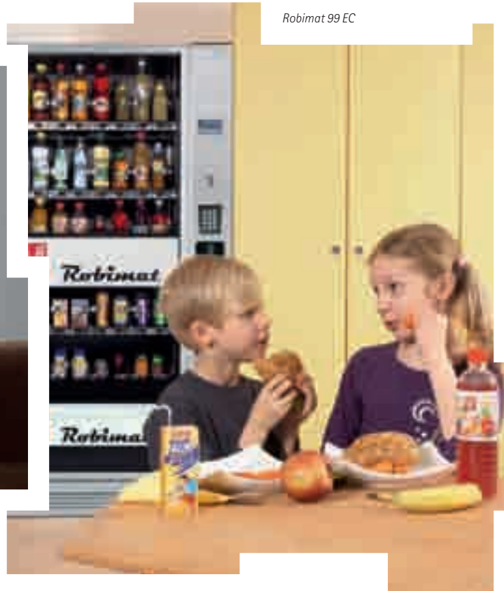
Robimat 99 EC