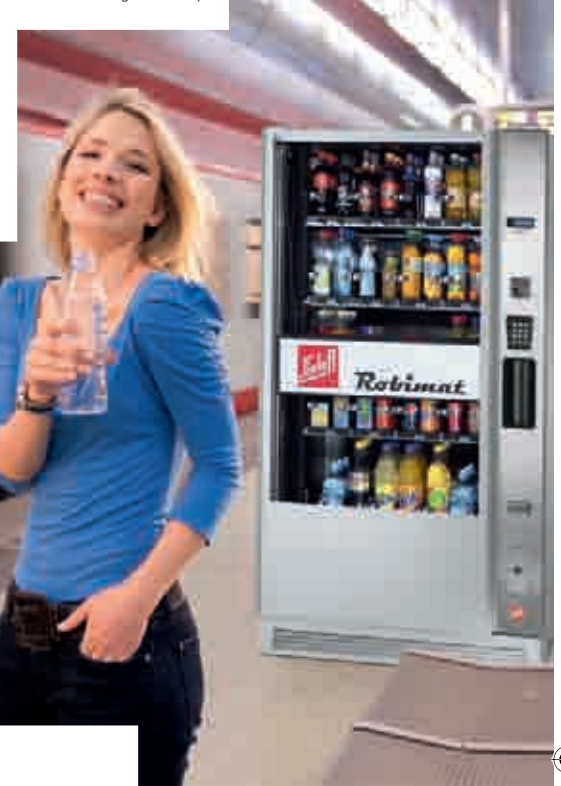
Robimat 99 High-Security