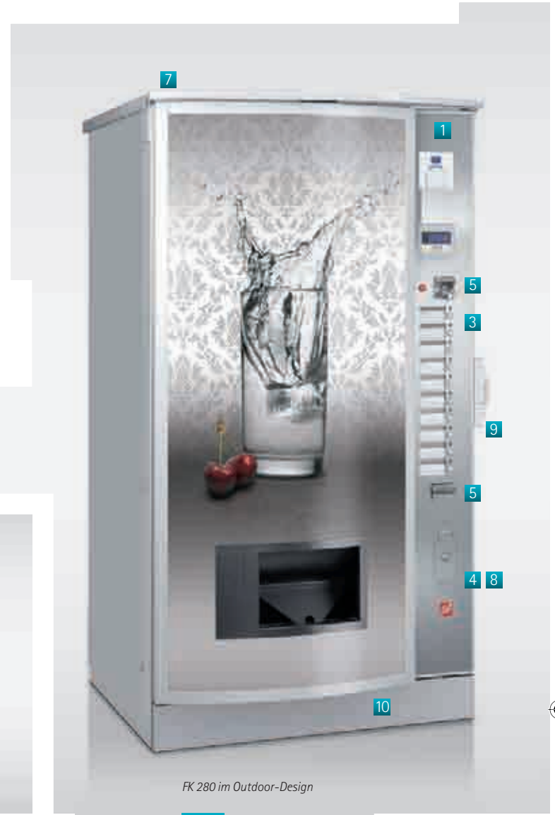
FK 280 im Outdoor-Design