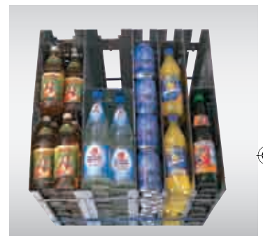
1-fach bis 4-fach Produktlagerung in der FK-Serie